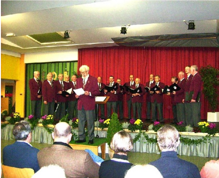
Unser Männerchor - Konzert 2009