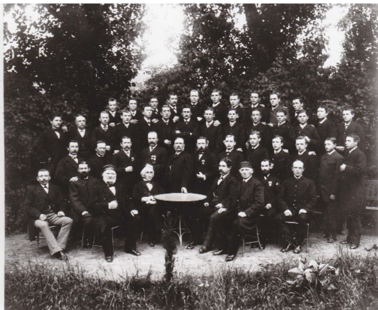
Der Chor im Jahr 1988